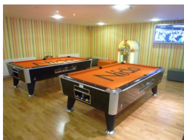
Salón de Estudiantes