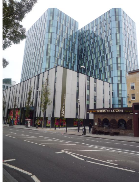
Nido London 200 Pentonville Road London N1 9JS