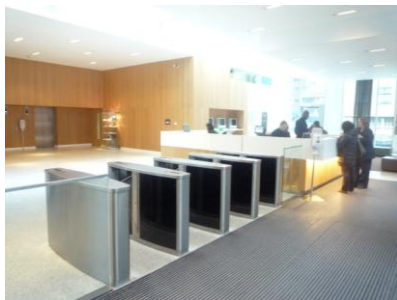
Entrada a la Residencia