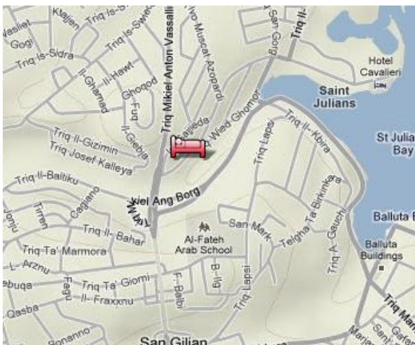
Apartamentos Meridian Triq il-Mensija, St Julians, MALTA