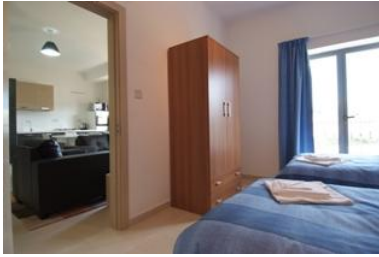
Habitaciones dobles con baño