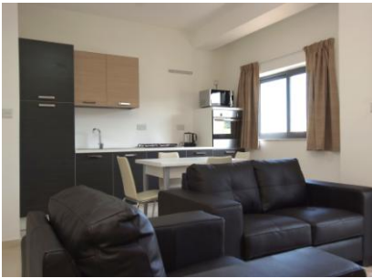
Cocina y salón equipados